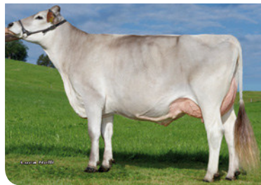
VASARY - Tochter Medina Zü: Stückl Johann, Ufiring